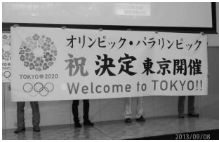
オリンピック・パラリンピック 9/8