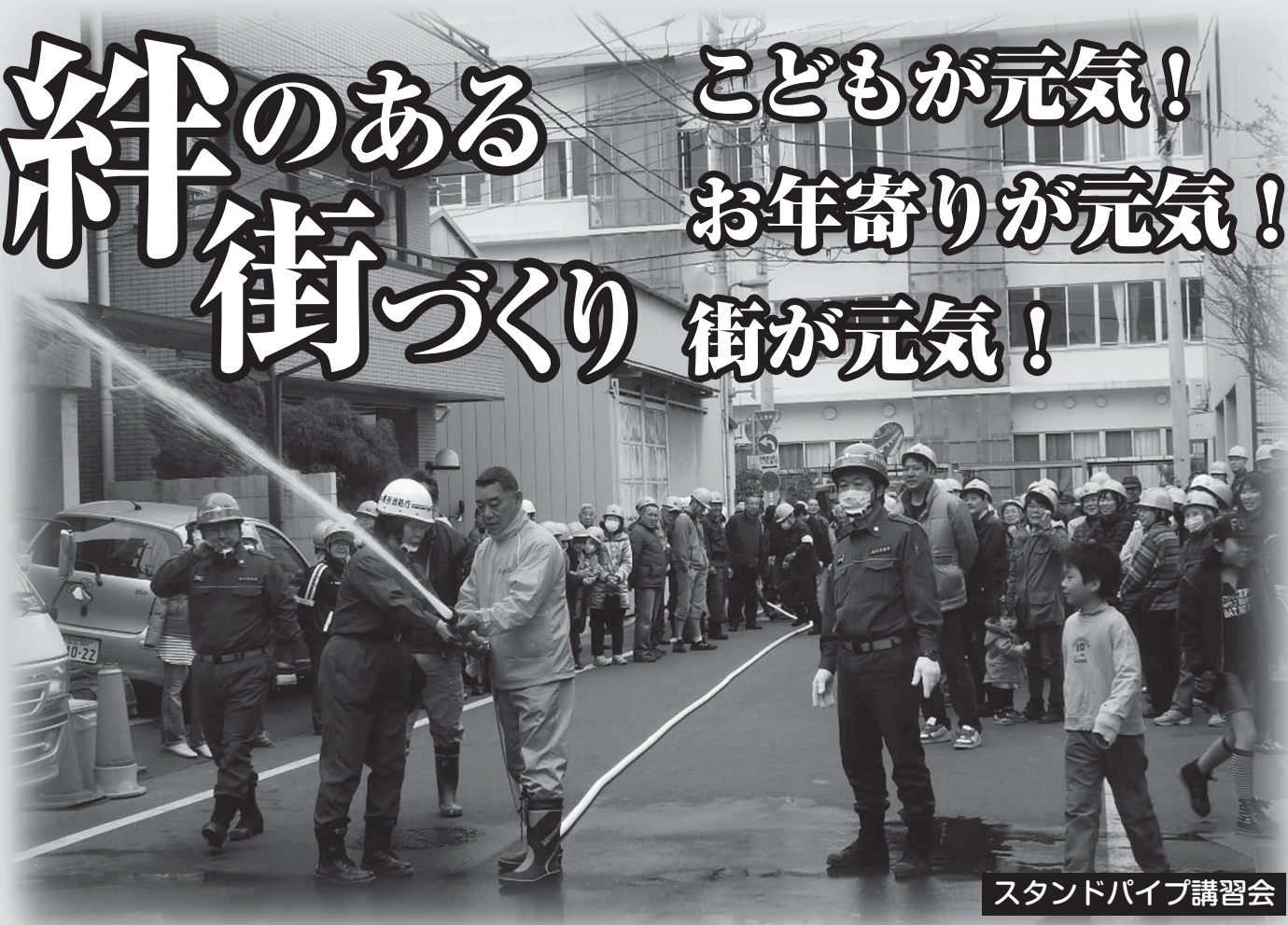
スタンドパイプ講習会