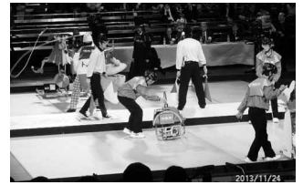
ロボコン全国大会 11/24