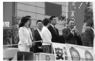
参議員選挙街頭あいさつ 6/8