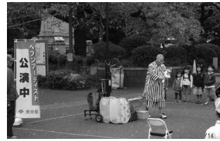
ヘブンアーティスト 11/4