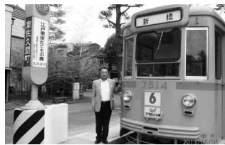
江戸東京たてもの園 6/5