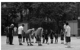
川南小サッカー・親子試合