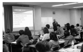
深川ハケ町防災協議会