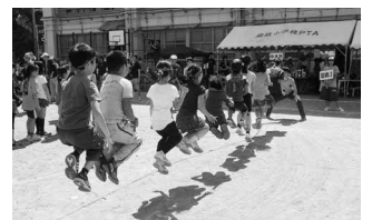
深川ハケ町子供大運動会