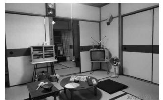
足立郷土資料館・昔の暮らし 8/1